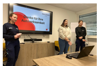
Impressionen von Tech Girls Change 2024/2025